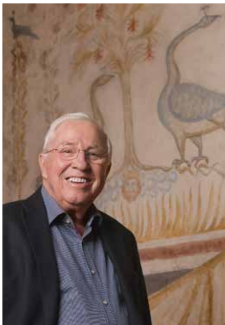
«Starke Produkte»: Unternehmer Blocher.

durch die viele Menschen mittleren Alters ins Land kommen, die in ihren jungen, gesunden Jahren nichts in das System einbezahlt haben, nun aber dessen Leistungen genau gleich beziehen. Was sollen wir zusätzlich tun? Im Kanton Zürich verlangen wir zum Beispiel, dass die Krankenkassenprämien von den Steuern abgezogen werden können.